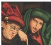
MIKE DASH LA FEBBRE DEI TULIPANI La prima grande crisi economica della storia Traduzione di Roberto Bertoni

Proposta di libri su temi di Economia e Finanza, funzionali all'approfondimento dei temi connessi ai film: